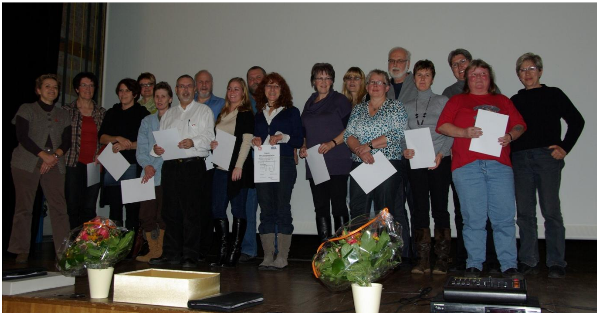
SKG Gruppenleiter 2011